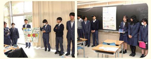
発表リハーサル(永本建設)