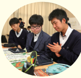
発表内容確認中(アダージョ)