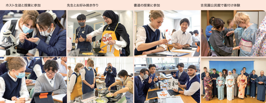
ホスト生徒と授業に参加

留学生を迎える前は不安も多くありましたが、彼女らは私よりもずっと落ち着いており、逆にリードされる場面が多々ありました。受入期間中はインフルエンザの流行で学校閉鎖となり、家で過ごす時間が長くなりました。その際、英語力不足で上手く伝わらないこともありましたが、たくさんのおいしさを味わうことができました。最終的には「引き受けて良かった」と心から思える経験となり、これを機に、今度は自分自身も留学に挑戦してみたいと感じるようになりました。