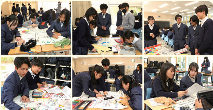
模造紙作成中(サムエル未来こどもの園)