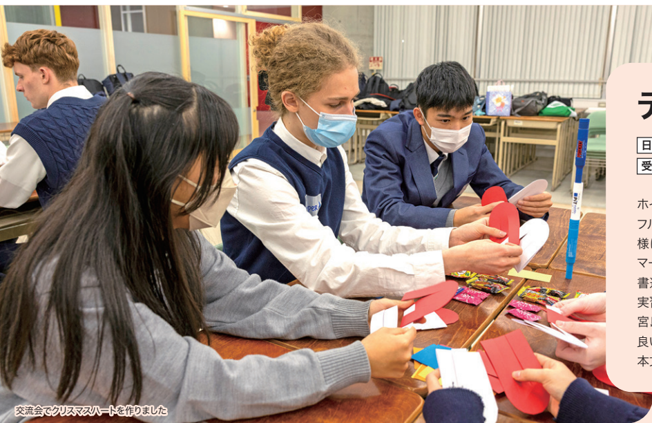
交流会でクリスマスカードを作りました

ホイエ・トストルブ・ギムナジウムの教員2名、生徒10名が滞りました。インフルエンザによる学校閉鎖で予定変更が多ありましたが、ホストファミリーの皆様にご対応いただきました。留学生たちは日本の生活を体験し、デンマークとの違いに驚く毎日でした。学校では、ホストの生徒と授業に参加した他、書道や、国際部との交流会を通して、多くの生徒と交流しながら学びました。調理実習は多くの先生方とお好み焼きを一緒に作りました。滞在中、縮景園、広島城、宮島、平和公園を訪れ、特に平和公園では、留学生ガイドが原爆について伝える良い機会となりました。更に、吉見園公民館のご協力のもと着付けを体験し、日本文化に触れました。生徒同士の交流が深まり、素晴らしい体験となりました。