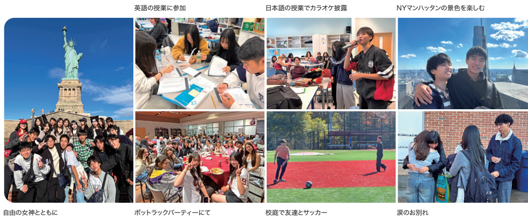
自由の女神とともに

アメリカ留学では、「多様性を受け入れる姿勢」と「主体的に行動する姿勢」が磨かれました。多様性については、様々な背景を持った人々との交流を通して、物事を多角的に捉えられるようになりました。また、海外で貴重な経験をしながら、積極的に行動し、自ら学びを深めることの大切さを学びました。見知らぬ土地で生活する機会を得たからこそ、感謝の重要性を実感できたと思います。今回関わってくださった方々に感謝しています。