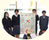
完成!(あいあいねっと)