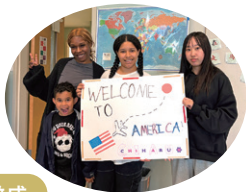
ホストファミリーと対面