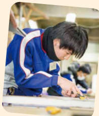
畳の作成(広島畳材)