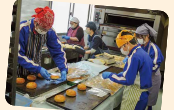
パンの袋詰め(アダージョ)