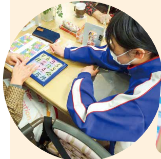
同じ高さの目線で(ゆうゆう)