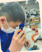
延長コードを作る(田中電機工業)