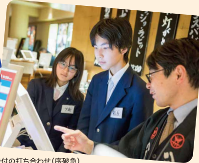
受付の打ち合わせ(序破急)