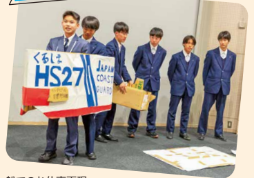
船でのお仕事再現