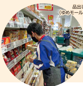
品出し(ゆめモール)