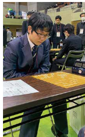
成績 男子個人戦 予選敗退 (2勝2敗・66位)