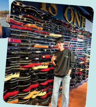
ハードロックカフェ