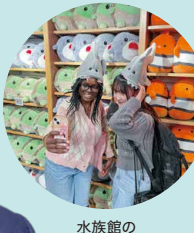
水族館のお土産コーナー

訪問 Center for Global Studies (アメリカ コネチカット州)