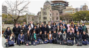
留学生ガイド 原爆ドーム前にて