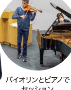
バイオリンとピアノでセッション