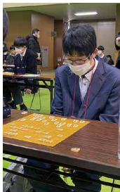
成績 男子個人戦 決勝トーナメント2回戦敗退 (ベスト16)