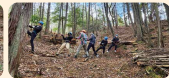
みんなで引っ張るぞ(もりメイト)