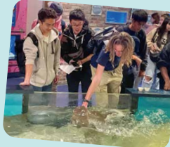
水族館のエイを触れるプール