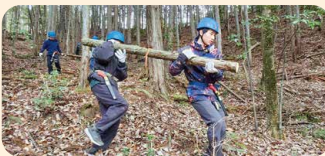
協力することの大切さ(もりメイト)