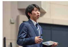
4年3組 / 新 日向

今回の発表を通して世界の水問題がとても深刻であることを知り、少しでも問題を解決できるように行動していきたいと感じました。本番では練習の成果を発揮でき、過去一番の発表で金賞を獲得することができ、とても嬉しく思います。