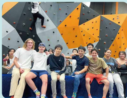
スカイゾーン(トランボルンやボルダリングなどができる施設)

アメリカでの交換留学は忘れられない貴重な体験となりました。授業を通して英語力を向上させ、CGS生と交流することで異文化理解を深めることができました。ホストファミリーとの生活では、日常会話を通してアメリカの文化や価値観に触れ、交流の大切さを実感しました。ニューヨーク観光では、街のエネルギーや多様性に圧倒されました。この研修で、語学力だけでなく、視野を広げることができました。