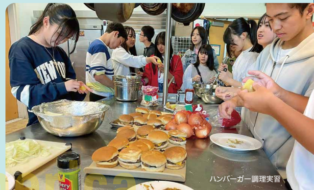
ハンバーガー調理実習