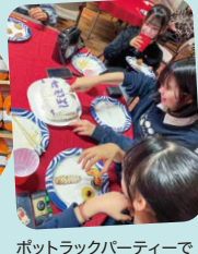
ポットラックパーティーで誕生日を祝ってもらいました