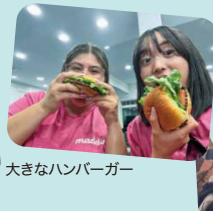
大きなハンバーガー