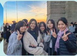
ブルックリン橋で日没