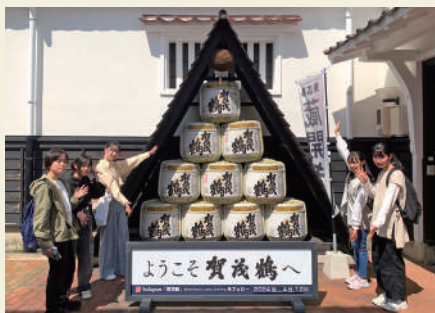
西条酒蔵通りにて

安芸国分寺と広島大学総合博物館をチェックポイントとし、それ以外は「酒蔵の街」西条を象徴する西条酒蔵通りや鏡山公園など、各班でそれぞれ決めた場所を思い思いに散策しました。最後は、県内最大級の前方後円墳のある三ツ城古墳に集合し、文字通りの遠足となりました。心地よい晴天の下、歴史や学問の空間を体感しながら、クラスメイトとの親睦を深めた1日でした。