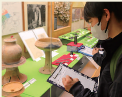
興味をもった展示をスケッチ

絶好の遠足日和の中、自然と歴史にあふれる「みよし風土記の丘」を訪れました。広島県立歴史民俗博物館の見学では、展示されている出土品などをスケッチし、展示に沿った問題を解くことで歴史の理解を深めました。また、班で協力して謎解きウォークラリーや勾玉づくりを行うことで、新しいクラスでの親睦が一層深まりました。2年生最初の行事を楽しむとともに、秋休みに研修旅行を控える学年として、良いスタートをきることができました。