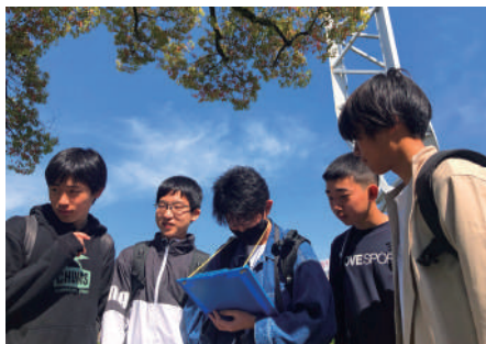
新しい仲間と再発見するHIROSHIMA

「クラスの親睦を深める」とこと「広島 (HIROSHIMA) を知る」ことを目的とし、平和記念公園周辺のウォークラリーを実施しました。班で協力して様々な問題に取り組む中で、新しいクラスメイトと積極的に言葉を交わせるようになりました。また、「平和学習」という視点で日々過ごす街を歩くことで、「広島 (HIROSHIMA) 」が発信する平和への願いを改めて感じることができました。