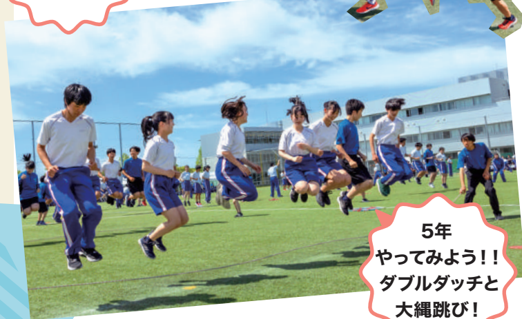
5年 やってみよう!! ダブルダッチと 大縄跳び!