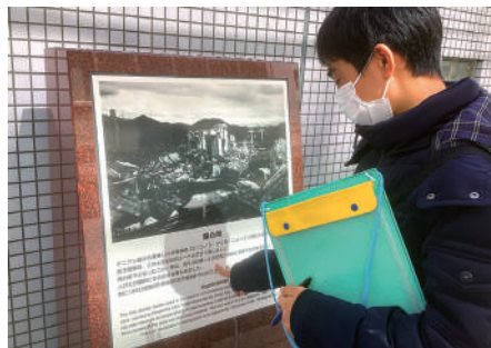
爆心地説明の碑にて