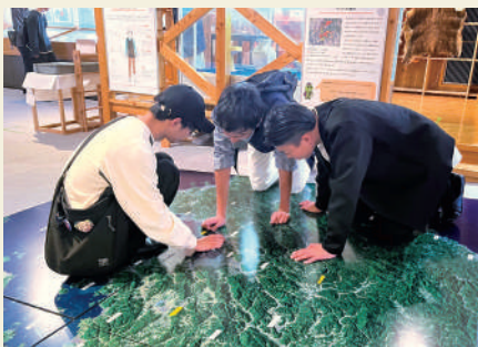
広島大学総合博物館にて