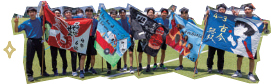
5・6年女子 押忍!大玉