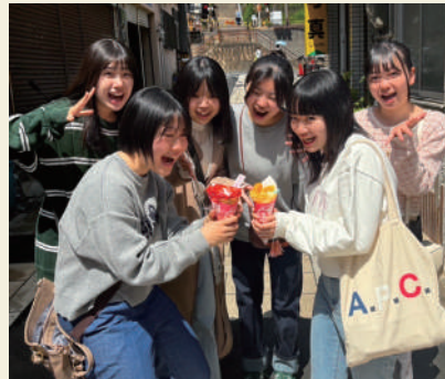
フォトコンテスト優勝作品：タイトル「グアー！」