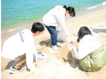
海辺に流れ着いているものを観察

空は晴れわり風が穏やかな遠足日和の中、生徒は水族館を見学したり、海辺で遊んだり、アスレチックを楽しんだりしました。また、希望者対象に砂浜の漂流物から考察する「ビーチコーミング」や水族館の裏側を見ることができる「バックヤード見学」を行いました。5年生になって最初の学校行事を新たなクラスメイトや新たな学年の先生方と一緒に、各々充実した時間を過ごしました。