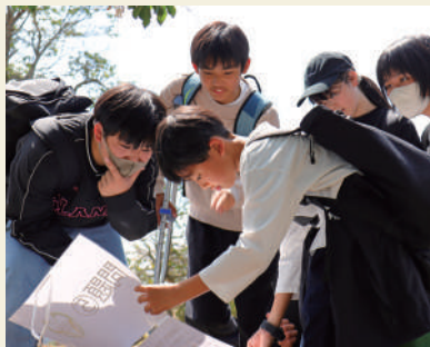
班で協力して謎解き