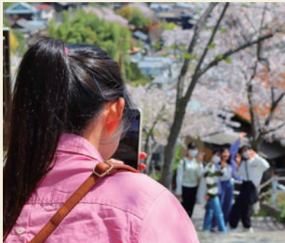
桜が残る中、各班で写真撮影

桜のピークは過ぎていましたが、まだ桜の花びらが残っていたため、千光寺公園で桜をバックにクラスごとで記念撮影を行いました。その後は、班ごとに尾道市内を自由散策しました。昼食も各班自由に選び、様々な尾道グルメを楽しみました。また、遠足内でフォトコンテストを実施し、各班それぞれ工夫を凝らした素敵な写真がたくさん撮れました。