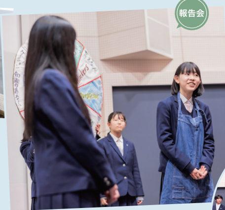
つきのひかり 園の1日のスケジュールを紹介