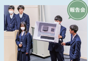
田中電機工業 自作制御盤の紹介