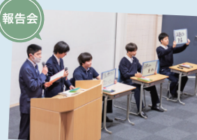
広島畳材 クイズによる仕事紹介