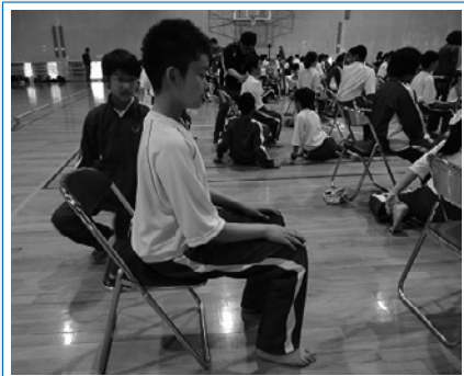
正しいイスの座り方

1日目の午前中は校長講話、校歌練習を通して、なぎさ生としての自覚を高めていきました。その後、広島工業大学沼田校舎へ移動し、講師を招いてのからだの使い方・正しいイスの座り方の指導、乗馬体験、NAP(Nagisa Adventure Program)、大縄跳びなど様々なプログラムを体験しました。1泊2日の生活の中で集団行動の大切さを学びながら、生徒同士の親睦を深めていきました。みんなで声を掛け合って、協力する姿が随所に見られ、集団としての成長を感じました。6年間のいいスタートを切ることができました。