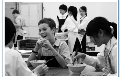
自分たちで作った手打ちうどんの試食