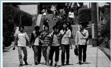
風情ある町並みを堪能