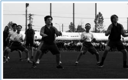
ハカのパフォーマンス(体育祭)