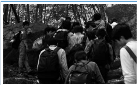
巨大な岩がそびえる山頂への道