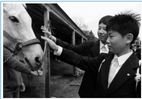
馬場での馬とのふれあい