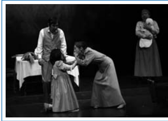
ヘレンにとまどう家族