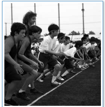
ともに戦いました(体育祭)

ニュージーランドのパサデナ中学校から、19名の留学生を迎えました。期間中は本校留学生の家にホームステイし、ともに生活する中で友情を深めていきました。パサデナの留学生は本校の授業や体育祭に参加したり、書道などの日本文化を学んだり、平和公園を訪ねて学習したりと、充実した毎日を過ごしました。本校2年生の生徒たちは協力して歓迎会の準備をし、ニュージーランドからの友達をあたかく迎えることができました。授業中や休憩時間は言葉の壁を越えて分かり合おうとする姿が見られ、外国語や自分たちとは違う文化に興味を持つことができました。7月末には本校の生徒がニュージーランドへ留学します。留学生たちは再会を心待ちにしています。