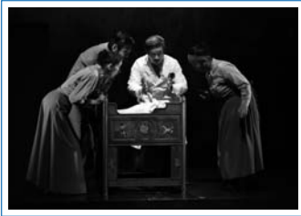
ヘレン・ケラー誕生