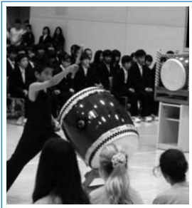
日本文化を披露(歓迎会)