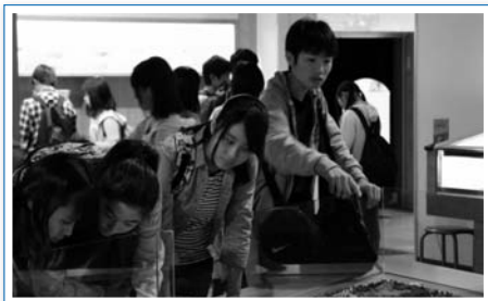
研修旅行へ向けて学びの姿勢で取り組みました