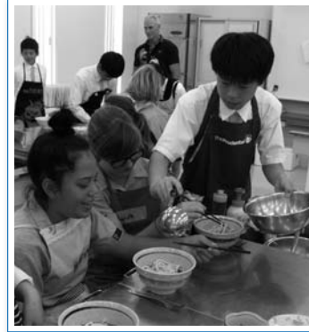
美味しく作れました