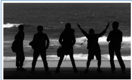
日本海の風を全身で感じる瞬間