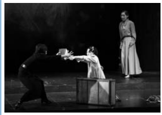
サリバン先生とヘレンの出会い