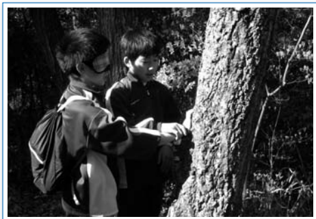
目隠しで木の感触を感じました

り、校歌を練習したりする過程で、中学生になるための自覚を高めていきました。2日目は、春の彩りあふれる豊かな自然に囲まれて大縄跳びやNAP(なぎさアドベンチャープログラム)や探検を行い、クラスで協力したり励まし合ったりしながら次第に打ち解けていきました。時間を守る大切さや集団生活の難しさなど学校生活を送る上で重要な多くの気づきを得た、充実した2日間となりました。