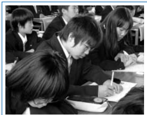
メモをとりながら講話を聞きました