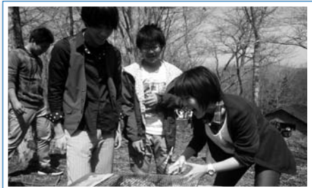
火おこしに悪戦苦闘しました