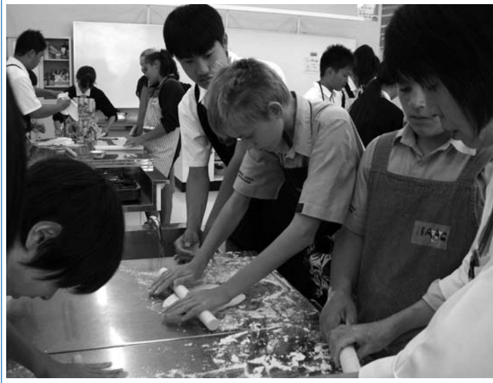
手打ちうどんに挑戦!