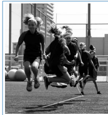
大縄跳びに参加(体育祭)