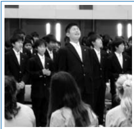
エール交換(歓迎会)