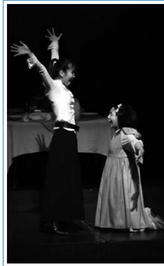
サリバン先生とヘレンとが心を通わせる瞬間