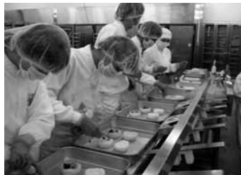
株式会社ボブラ 食品製造工場で体験をする生徒