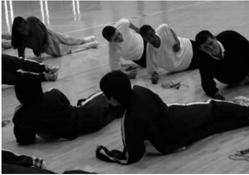
「うっ…きつい…」 4年生体育授業 準備運動の体幹トレーニング体験

アメリカ コネチカット州のCGS(Center for Global Studies at Brien McMahon High School)から日本に深い興味を持つ5名の留学生が来校しました。留学生達は、学校では生徒たちと一緒に様々な授業に参加し、週末はホームステイ先の家族とともに過ごし、短いながらも日本を、広島を体験しました。