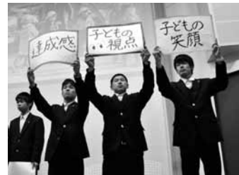
報告会(サムエル未来幼稚園) 学びを3つのキーワードで発表します