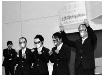
報告会(オタフクソース) お好み戦隊オタフクレンジャー登場!!