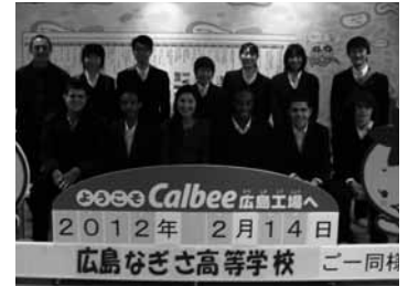
高三と共にカルビー広島工場見学

今年はより多くの生徒が何らかの形で留学生とのコミュニケーションをはかる機会を提供することを目的の一つとして、留学生の時間割を組みました。2回目の来日となる生徒が4名もいて、彼らの日本に対する興味、関心や理解度に刺激を受けた生徒も多かったようです。交流会にも多くの生徒が参加し、大いに盛り上がっていました。お互いに相手を気遣い、足りない言葉を補いながらのコミュニケーションは、相互理解、国際交流に向けてのきっかけとなったのではないのでしょうか。