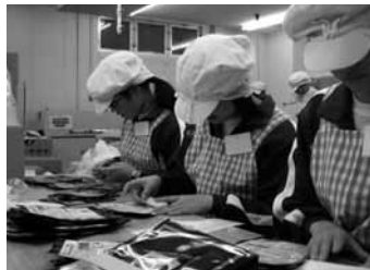
株式会社マルタカ 実際に店舗に並ぶ商品にラベルを貼る生徒

その後、約1カ月かけてLHRや放課後の時間を使い、仕事ウォッチングで得たことをグループごとにまとめました。午前中は4つに分かれ、分科会方式で40社のうちから全体発表を行う8社を選びました。午後からはシェルホールで全体発表を行いました。各グループが演劇やフリップなど様々な工夫を凝らした発表を行い、「働くとは」ということについて考えを深めるよりよい機会となりました。