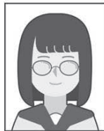
眼鏡が反射して目が確認できない