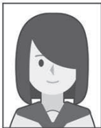
前髪で目が隠れている