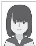
前髪や影が目にかかっている