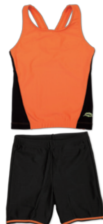
●水着(女子用セパレート)