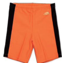
●水着(男子用ロング)