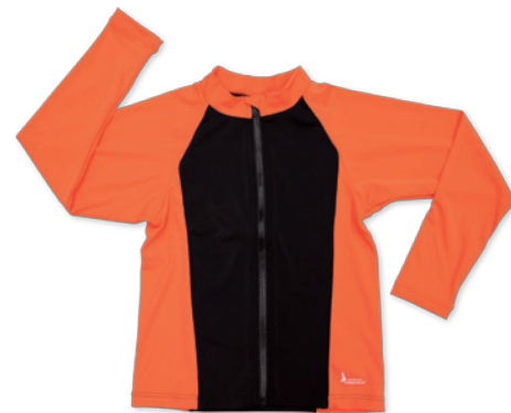
●ラッシュガード(オプション・男女兼用) 日焼け防止などの紫外線対策のために 着用を希望される方はご購入ください。