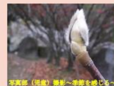
写真部（児童）撮影～季節を感じる～

今年度も残すところ、3か月。教職員、児童、保護者の皆様、応援して下さる関係の皆様と手を携え、なぎさっ子の成長に寄与してまいります。